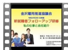
発表風景動画【会社別】